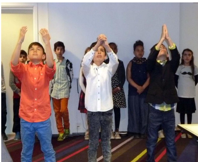
Elever i fjärde klass från Fjell skole, i rollspel om mångfald och integrering