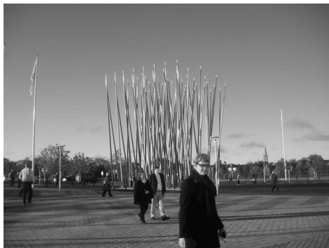
Konstnärlig utsmyckning utanför Cloetta Center

Inte undra på att det går så bra för LHC med en