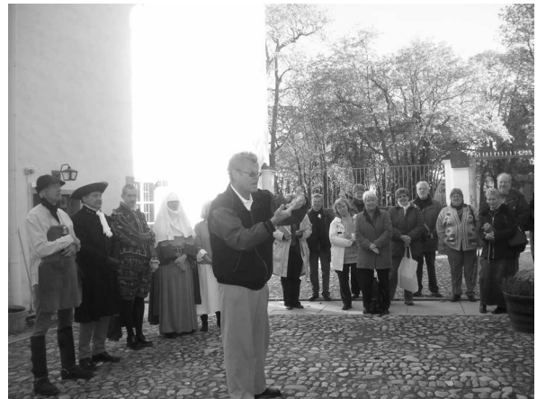
Landshövdingen gör PR för Östergötland

från museet, någon var mer professionell. Spektaklet kallas "ett sus genom seklerna" och vi kan bara hoppas att inte ekonomiska skäl gör att vi var bland de sista som fick njuta av detta sus.