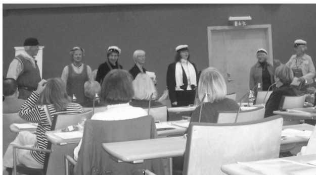
Uppsala- och Sigtunaguider bjuder in till SveGuide 2005

Den punkt som vållar debatt är förslaget till utbildningsplan. Men efter en stund så enas vi om smärre ändringar och kan sedan anta den som ett måldokument. Vi är väl medvetna om att planen inte kan genomföras över hela landet på ett enda bräde. Men på sikt är den vad som behövs för att föra guideutbildning och auktorisation framåt. Efter revidering kommer den att finnas tillgänglig som mejldokument för den som vill läsa.