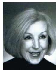
ledamot A g n e t a